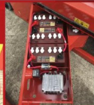
Gabinete de baterías